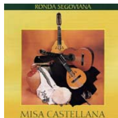
“Misa Castellana” - 1997