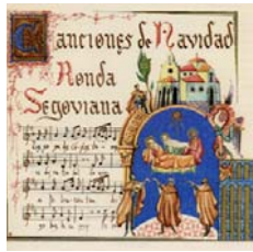
“Canciones de Navidad” - 2007