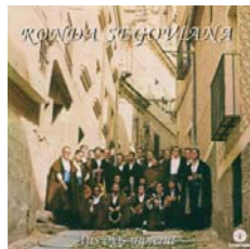
“Tus Ojos Morena” - 1980