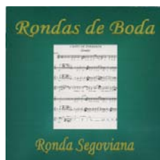
“Rondas de Boda” - 2002